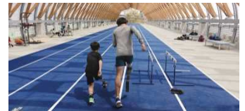
ギソクの図書館 （イメージ写真）