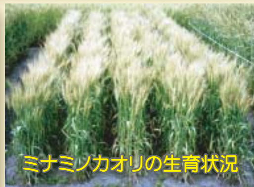
ミナミノカオリの生育状況