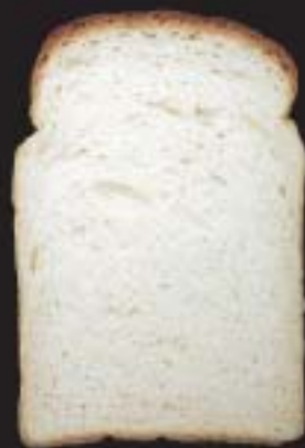
ニシノカオリ (現行品種)