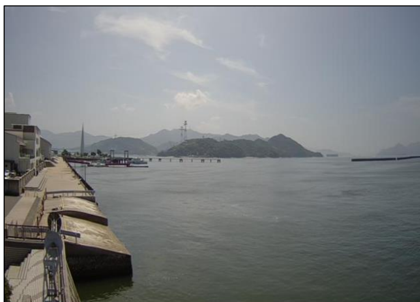
【公開画像例（広島検潮所）】