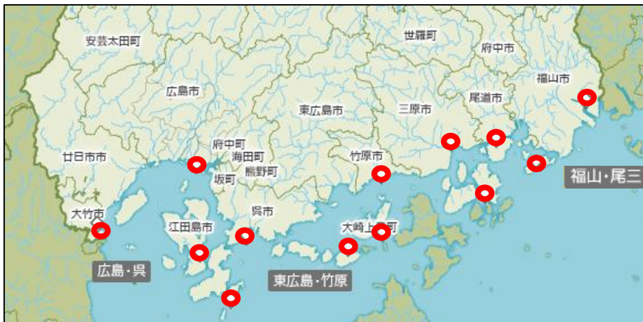
【海岸カメラ設置箇所 位置図】