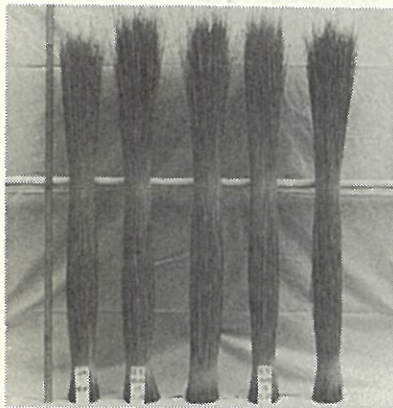
12月植(標準) 7月19日 8月5日 7月19日 8月5日 収穫 5月15日先刈 5月25日先刈 (春植) 春植栽培のいぐさ

いぐさ栽培の労力は10アール当り400～500時間で、そのうちおよそ25%が植付、25%が栽培管理、50%が収穫となっており、植付、収穫に労力が集中している。またいぐさの植付けは普通11月中旬から12月にわたって行われ、寒中での作業は