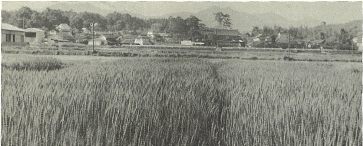
コムギのバラまき栽培