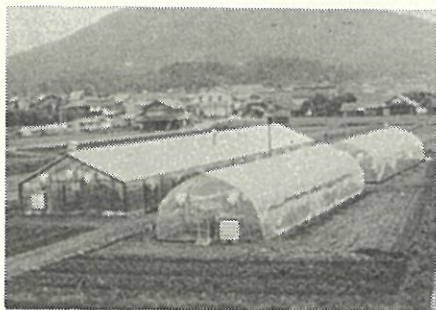
高冷地試験地野菜ハウス

本試験地は北部高冷地帯における水稲を初め、野菜・飼料作物の生産性を高めるために、昭和26年4月、山県郡大朝町に設立され今日に至っている。