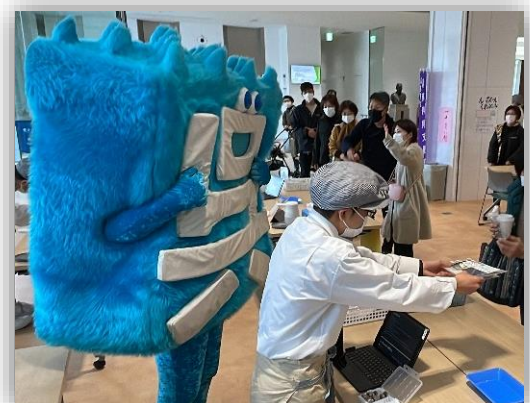
今年3月、呉市役所シビックマーケットでの出店の様子