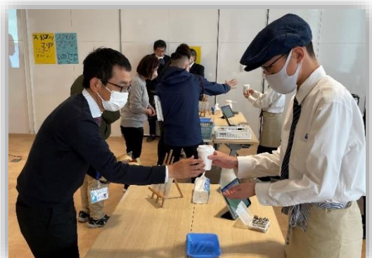
これまでの接客サービスの様子