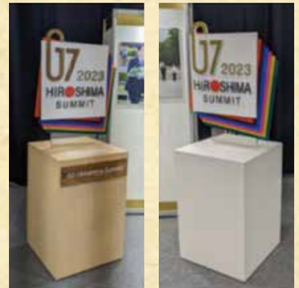
サミットロゴオブジェ (左は被爆樹木使用) Summit Logo Object (A tree that survived the atomic bombing has been used for the object on the left)