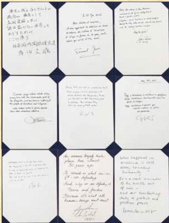
G7首脳の芳名録 Guest book entries of G7 Leaders