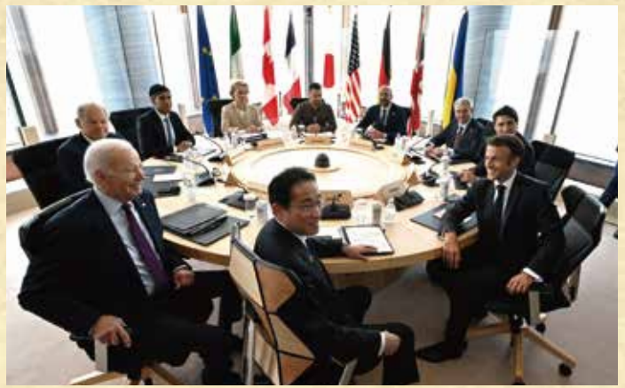
サミットで使用された円卓等 Round table used at the summit