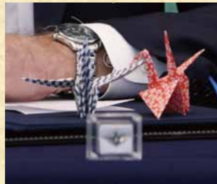
バイデン米大統領が持参した折り鶴

* Actual exhibits will be on display from July 25 (Tuesday) and replaced by replicas after August 7 (Monday).