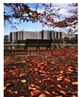
最優秀賞(たてフェス賞) 市営基町アパート