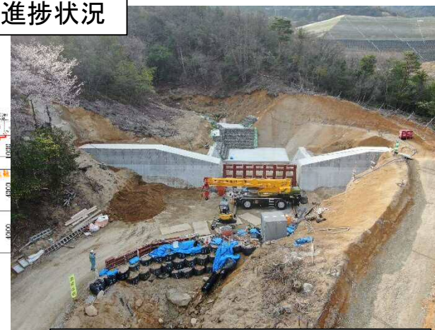
工事完了（令和5年3月29日）