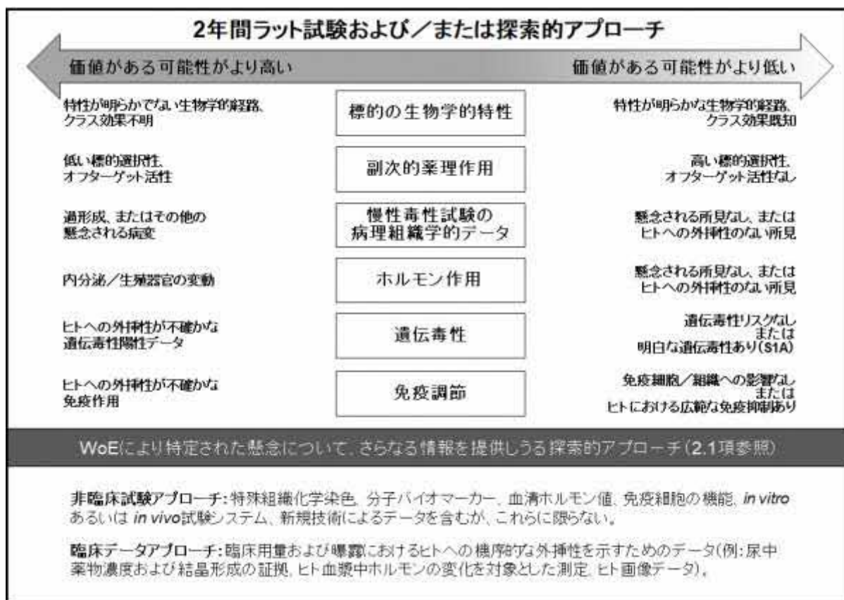
図 2: ヒト発がんリスク評価のために 2 年間ラット試験を実施する価値に関する、鍵となる WoE 要素およびさらなる情報を提供しうる探索的アプローチの統合。WoE 特性のすべてが図の右側に並ぶ場合、2 年間ラット試験が価値を付与しないと結論づけられる可能性が高くなる。遺伝毒性の WoE 要素については、遺伝毒性リスクがない場合または明確な遺伝毒性リスクがある場合のいずれも、2 年間ラット試験に価値がある可能性はより低いことに留意されたい。同様に、免疫調節の WoE 要素については、免疫系に影響がない場合または広範な免疫抑制がある場合のいずれも、2 年間ラット試験に価値がある可能性はより低い。

ICH S1 前向き評価研究 [S1(R1): 医薬品のげっ歯類がん原生試験の変更 (案) - 規制通知文書] で得られた経験に基づく主要な結果と事例の要約を付録に示し、ヒト発がんリスク評価において 2 年間ラット試験実施の価値を判断する際に、WoE 要素をどのように統合することが可能かについて示す。