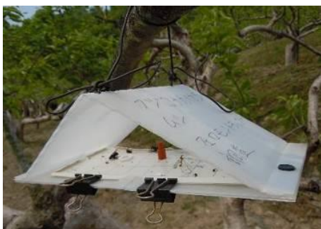
写真3 フェロモントラップ設置状況

調査期間は4月下旬～9月下旬で、トラップに誘殺されたフジコナカイガラムシ雄成虫数を7日間隔で調査した。