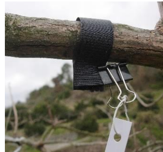
写真6 バンドトラップの設置状況