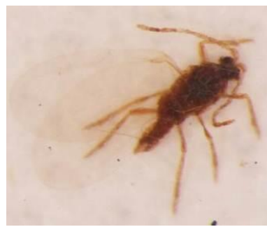
写真4 性フェロモントラップに誘殺されたフジコナカイガラムシ雄成虫