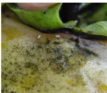
写真1 フジコナカイガラムシの排泄物により、すす病を併発したかき被害果

そこで、広島県南東部のかき園地に性フェロモントラップとバンドトラップを設置してフジコナカイガラムシの生育ステージを予測し、防除時期の判定に役立てた。