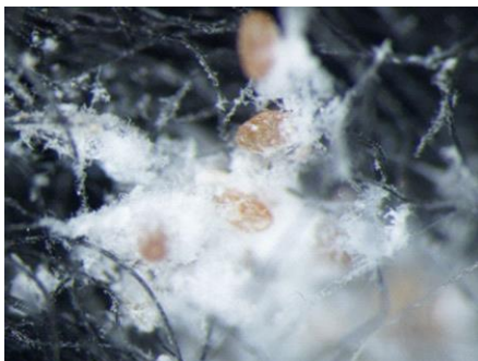
写真7 卵のう (バンドトラップ内)

第2世代の卵のうは、2013年は、7月16日で0個だったが7月24日に18個確認され、発生ピークは7月6半旬となった。2014年は、7月23日に0個だったが、7月30日に3個が確認され、発生ピークは7月6半旬となった。性フェロモントラップによる生育ステージの卵の発生日の予測は、2013年は7月31日、2014年は8月5日で、2014年の卵のうの発生ピークは第1世代と同様に性フェロモントラップ調査による予測日よりも半月遅いものの、それぞれの調査による卵のうの発消長はほぼ一致した。