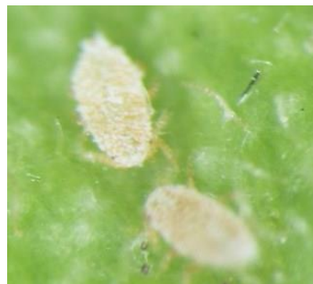
写真2 フジコナカイガラムシ若齢幼虫（1齢幼虫）