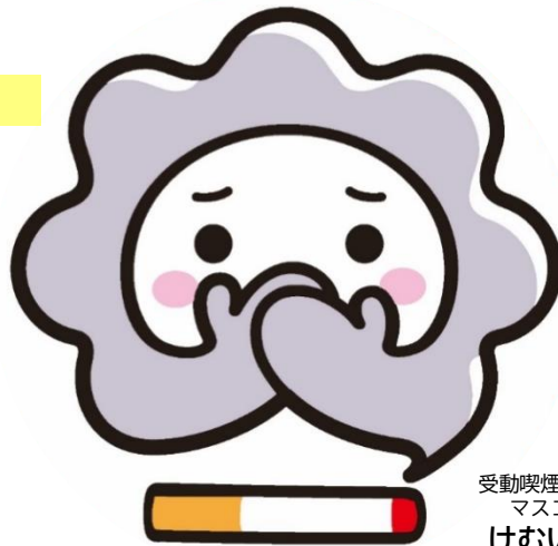
受動喫煙対策推進 マスコット けむいモン

広島県のホテル・旅館で、 「技術的基準」を満たしている 喫煙室を設置の割合は 18.3% (令和4年7月 広島県調査)