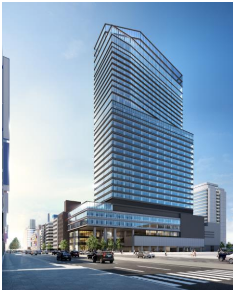
外観完成イメージパース