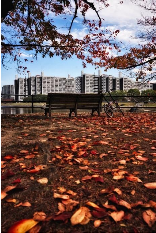
市営基町高層アパート (ユーザー名: fipad さん)

講評： 基町エリアの広がり (大きな建物が遠景に広がっている様子) や季節感が表現されている。また、構図、紅葉と白の対比により建物に目が惹かれる。