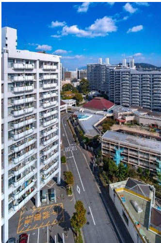
市営基町高層アパート上階より