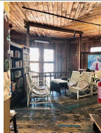
呉 YWCA