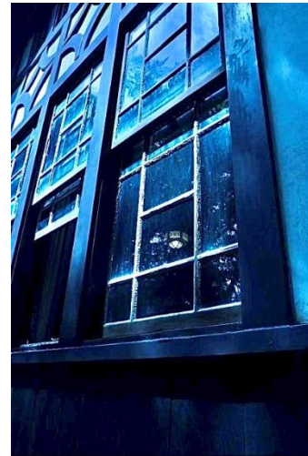
入船山記念館 ( tomomo_n_dayo さん)