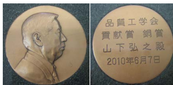
品質工学会 貢献賞 銅メダル