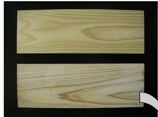
写真1 上：無処理のスギ辺材 下：リン酸系薬剤を注入したスギ辺材

なお、防火材料として認定されるには、国土交通大臣が指定した検査機関による性能評価試験（発熱性試験及びガス有害性試験）が必要になります。