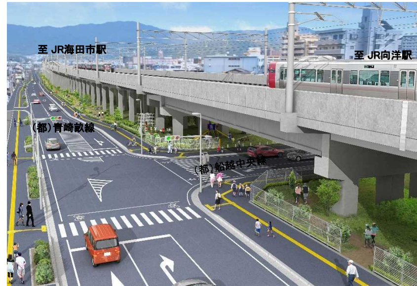
鉄道高架と関連街路の整備イメージ(広島市安芸区付近)