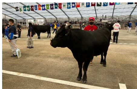
審査場でのリハーサル 体型を十分PRできるよう、審査姿勢の最終確認です。

次回北海道全共での上位入賞を目指し、更に、広島血統種雄牛の体型・産肉能力の向上を図ります。