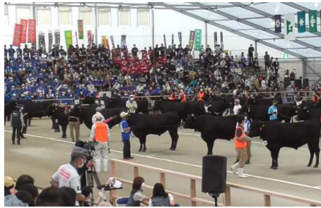
若雄区等級決定の様子 順位が決まる直前で、緊張感が高まります。