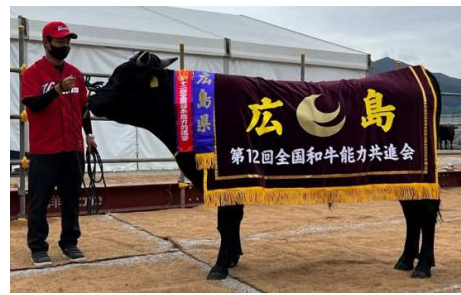
若雄区出品牛「仁義烏」 優等賞11席を受賞しました。