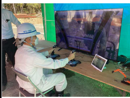
マシンガイダンスの体験