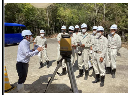
ワンマン測量（杭ナビ）の体験