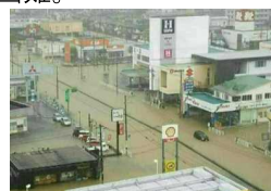
(平成30年7月 福山市蔵王排水区)