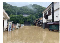
(令和3年7月 竹原市本川排水区)