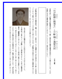
地域教材の開発や活用 （三次市立八幡小学校）