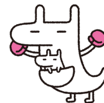
← 職場体験プログラム 募集チラシ