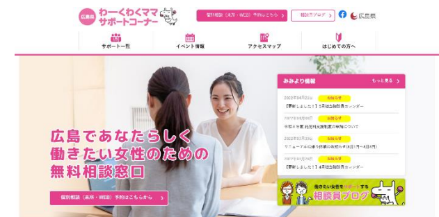
わーくわくママサポートコーナーHP

「わーくわくママサポートコーナー」(広島・福山・Web)に4名の女性相談員を配置するとともに、オンラインでの相談対応を行うなど個別キャリアコンサルティング機能を強化し、早期再就職を希望する女性にきめ細やかな相談対応を行った。