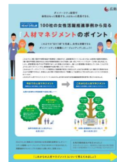
「人事制度のポイント」パンフレット