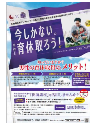
← 募集チラシ (男性育休取得促進)

出前講座を実施するとともに、令和3年7月に広島県と株式会社サンフレッチェ広島において「女性の活躍推進に関する連携協定」を締結し、女性活躍に不可欠な男性の育休取得促進を図るため、(株)サンフレッチェ広島を“広島県イクメン推進アンバサダー”に任命し、機運醸成を図ることとしており、サンフレッチェ広島レジーナの試合会場において、Cコースの情報と男性育休取得促進啓発チラシを一体型にしたチラシを作成し、配布した。