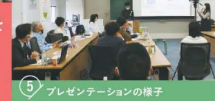
5 プレゼンテーションの様子