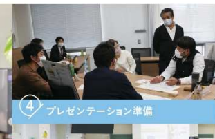
4 プレゼンテーション準備