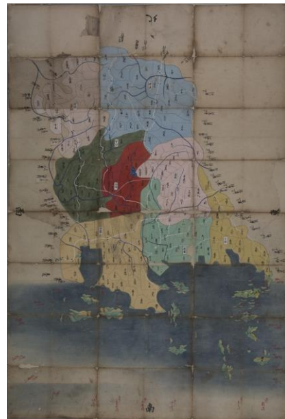
写真1 福山藩領絵図(守屋壽コレクション)