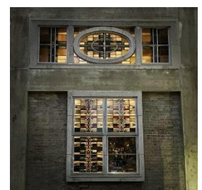
フォトコンテスト 最優秀賞(たてフェス賞) 世界平和記念聖堂