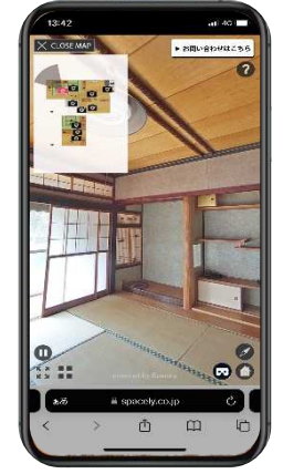
スマホでも自由な 視点で確認が可能