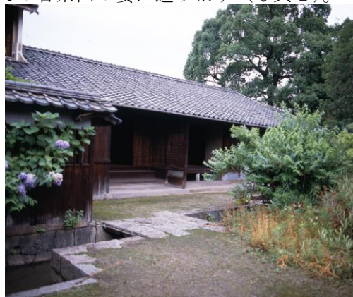
写真1 特別史跡廉塾 講堂