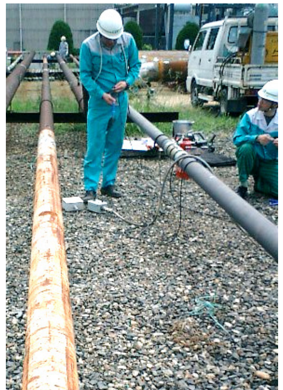
図3 プラント配管検査のイメージ