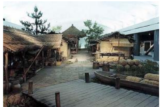
草戸千軒展示室「よみがえる草戸千軒」

お化け屋敷の仕掛けは、福山大学心理学科の学生が制作したものです。犯罪心理学の不安研究を逆手にとった仕掛けやその解説から、私たちがどのような状況を怖いと感じるかを、体験的に学習することもできます。