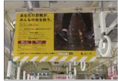
ポスターの掲示状況