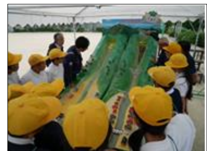
大型模型を用いた体験学習