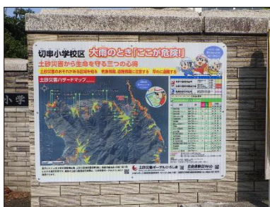
土砂災害警戒区域等の標識

VR 等の ICT 機器を活用した防災教育、大型模型や工事現場見学等を組み合わせた体験学習、マイ・タイムラインなど多分野に跨る防災教育など、国や関係課と連携し、より効果的な防災教育を実施する。