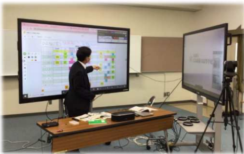
広島県立広島国泰寺高等学校