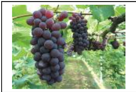
デラウェア(ぶどう)