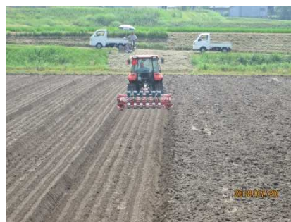
⑤耕起・施肥・播種