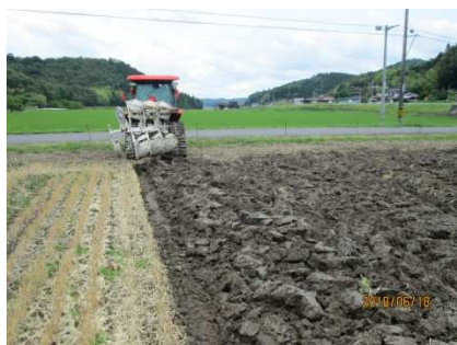
④ボトムプラウ施工