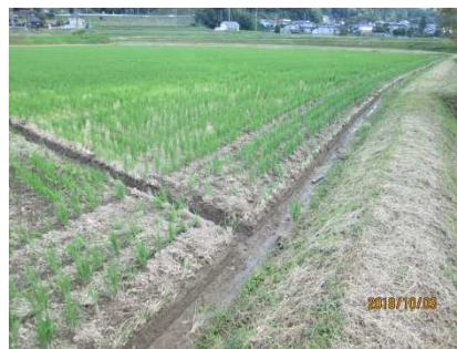
②圃場内排水溝の設置