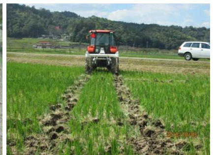
③ハーフソイラー施工