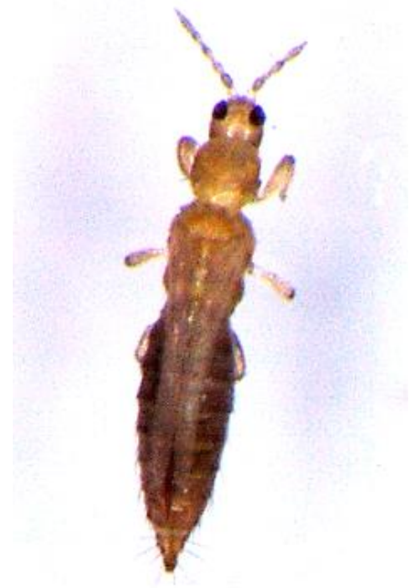
ネギアザミウマの成虫