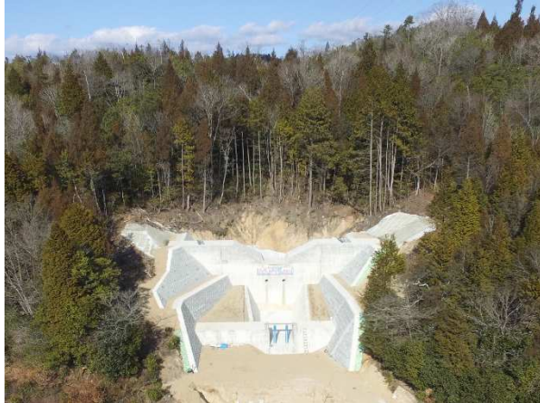
県：砂防激甚災害対策特別緊急事業 河頭隣2 (三原市大和町)