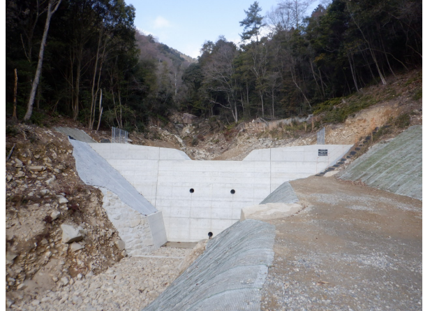
県：治山激甚災害対策特別緊急事業 エフリ谷地区 (呉市安浦町)