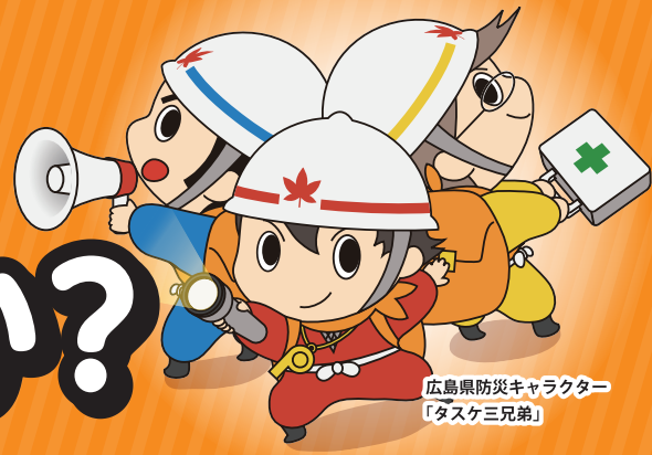
広島県防災キャラクター 「タスケ三兄弟」