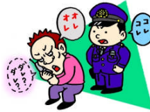
振り込め詐欺発生状況