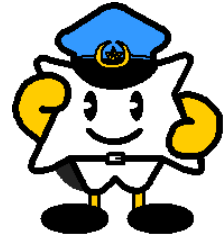
広島県警察マスコットキャラクター メイブル君