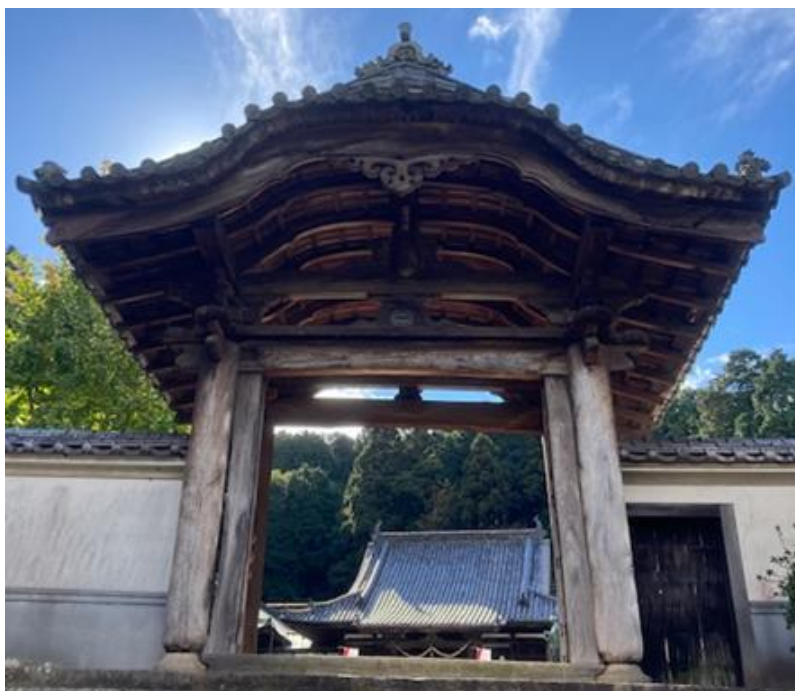
常国寺唐門 正面写真（参道側より）