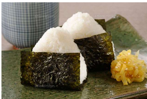
ご提案するメニュー おにぎり