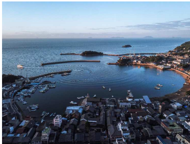
【一般部門】最優秀作品

【SNS部門】 https://tomo-machikata.jp/news/details/sns.html