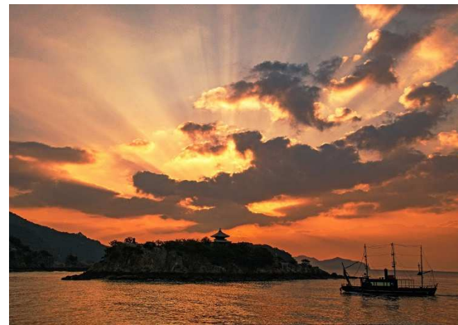
「後光放つ弁天島」奥田 憲昭 様