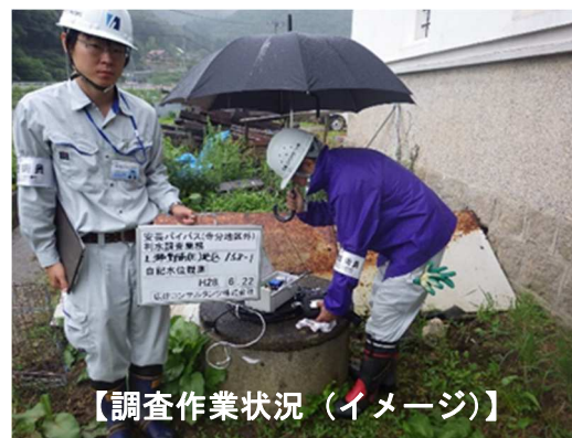
【調査作業状況（イメージ）】

種別：夜間全面通行止め 工事名：福山港港湾海岸保全工事（江の浦地区） 日時：7月26日 （22：00～翌5：00）