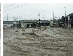
平成30年7月豪雨災害 [東広島市安芸津町]