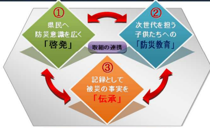
防災意識の醸成による地域防災力の向上

8. 20土砂災害の教訓を踏まえ、再び同じ災害を繰り返さないためには、土砂災害に関する防災意識の醸成を図るとともに、災害の記憶を風化させず、被災の事実を後世に伝承していく必要があります。 「土砂災害 啓発・伝承プロジェクト」 では、土砂災害への防災意識を県民へ広く啓発することに加えて、被災事実を地域に確実に伝承していく取組を積極的に実施することにより、地域防災力の向上を推進していきます。