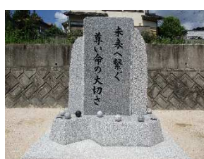
平成30年7月豪雨災害 石碑 [安芸郡熊野町川角]