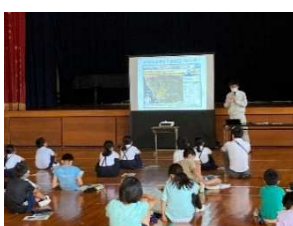
砂防出前講座 (坂町立小屋浦小学校)