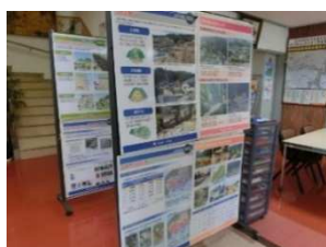
災害伝承パネル展 (広島市佐伯区河内公民館)