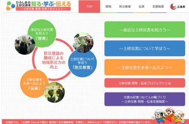
「ひろしまの土砂災害を知る・学ぶ・伝える」ポータルサイト