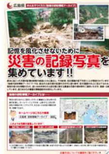
「地域の砂防情報アーカイブ」イメージ