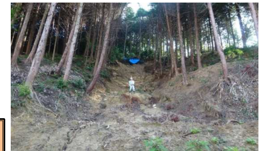
工事完了（令和3年12月20日）