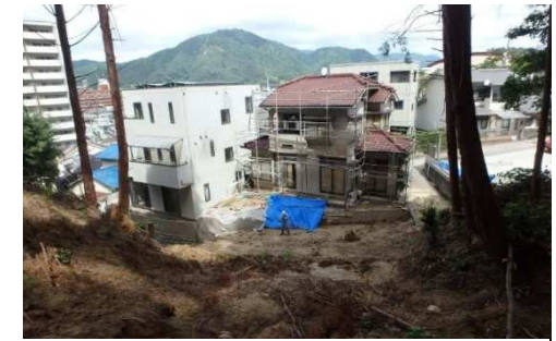
斜面崩壊・被災状況（H30年7月）