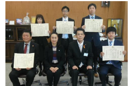
※ 令和元年度表彰企業