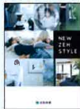
④NEW ZEH STYLE