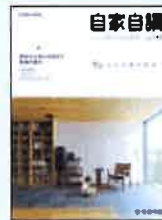
⑤実例集 Vol.140 (この土地が好き)