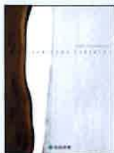
①住友林業の家 総合カタログ