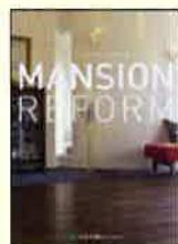
⑩実例集 マンションリフォーム