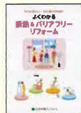
⑫よくわかる断熱& バリアフリーリフォーム