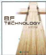
③BF TECHNOLOGY (テクノロジーカタログ)