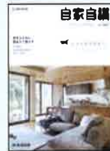
⑥実例集 Vol.141 (くつろぎの住まい)