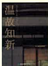
⑨実例集 旧家リフォーム