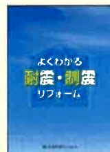
⑪よくわかる 耐震・制震リフォーム