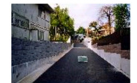
施工後(拡幅整備を実施)