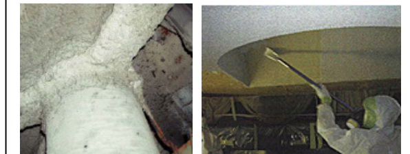
アスベスト調査・除却