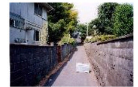
施工前(狭あいな道路)