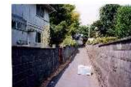
施工前(狭あいな道路)