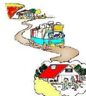
がけ地近接等危険住宅移転事業 狭あい道路整備等促進事業