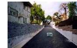
施工後(拡幅整備を実施)