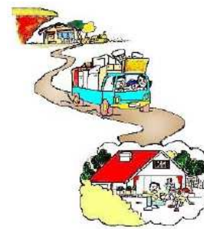
がけ地近接等危険住宅移転事業 狭あい道路整備等促進事業