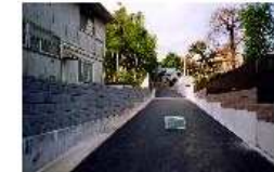
施工後(拡幅整備を実施)