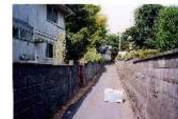
施工前(狭あいな道路)