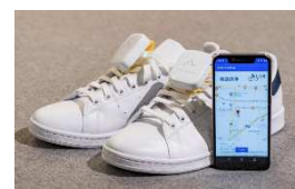
・視覚障がい者向け 靴挿入型歩行ナビゲーションの開発 (株式会社 Ashirase (東京都))