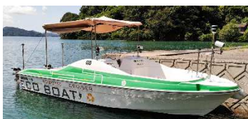
・自律航行小型EV船の開発 (株式会社エイトノット (大阪府))

今回の30件の実証を通じて、広島発の新しい生活様式を提案する様々な商品やサービスが創出された。