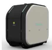
・自動積み下ろし機能を備えた 自動配送ロボットの開発 (Yper 株式会社 (東京都))