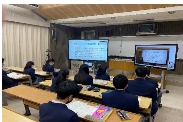
受信校（油木高等学校）